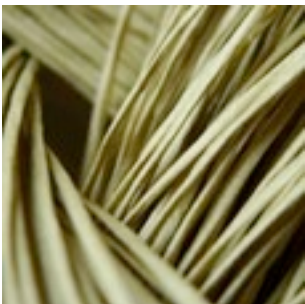
06-084 Tatami papirgarn strågrøn (Fed)