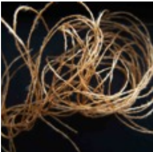
07-001-11 Polyester Krympegarn