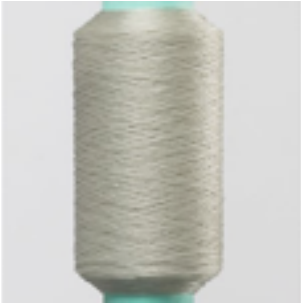
07-367 Rubco Klar Mat Nm 1,1