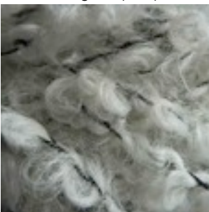
17-001-10 Uld Alpaka Sort/ Ecreu (krydsnøgle)