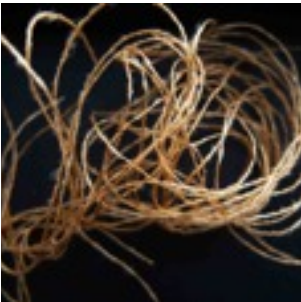
07-001-11 Polyester Krympegarn