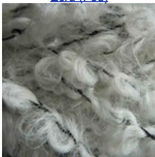
17-001-10 Uld Alpaka Sort/Ecru (krydsnøgle)