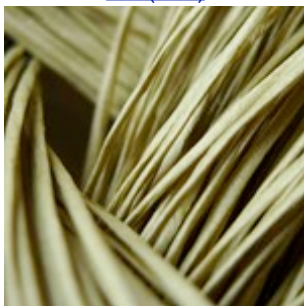
06-084 Tatami papirgarn strågrøn (Fed)