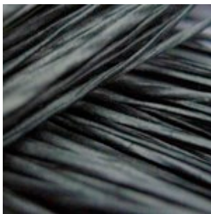
06-082 Tatami Papirgarn Sort (Fed)