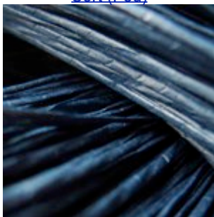
06-083 Tatami Papirgarn Blå (Fed)