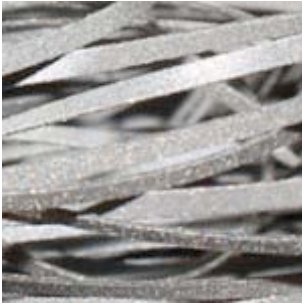
07-502 Refleks 1mm, sølv