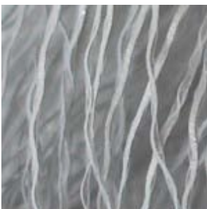
07-325-B Reflekta MX