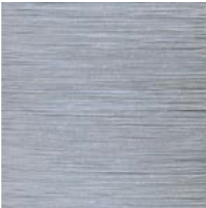
07-500 Refleks 302, sølv