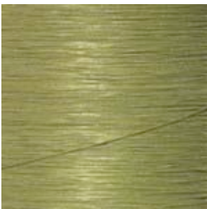
07-501 Refleks 301, guld